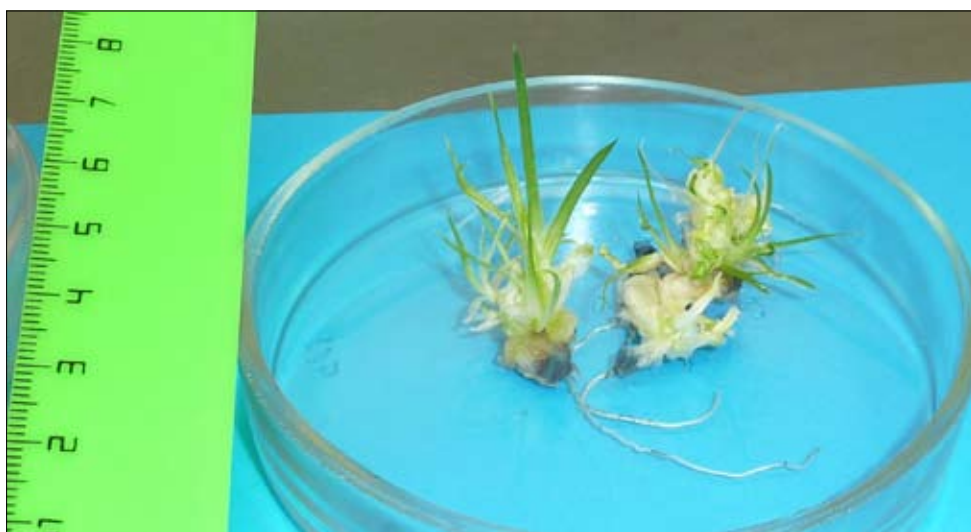
Рис. 1. Индукция адвентивных побегов из каллусной ткани, образовавшейся при прорастании незрелых семян Iris glaucescens на среде MS с добавлением 1 мг/л 2,4 Д + 0,5 мг/л БАП.

Незрелые семена I. glaucescens , I. bloudowii прорастали в течение 12–15 дней, сам период прорастания не превышал 30–40 дней, что значительно меньше сроков прорастания в культуре in vivo . Всхожесть семян была выше на безгормональной среде MS: для I. glaucescens – на 25,4%, для I. bloudowii – на 15,4%. У незрелых семян обоих видов на среде MS, включавшей 1 мг/л 2,4 Д и 0,5 мг/л БАП, кроме появления проростков, было отмечено также образование каллуса (табл. 3).